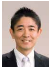
Sport(エスポート) リハビリテーション福祉コンダクター 理学療法士

「理学療法士からみた介護予防」、「作業療法士からみた住宅改修」を交代でそれぞれの視点から、専門的な知見を踏まえお伝えするコラムです。