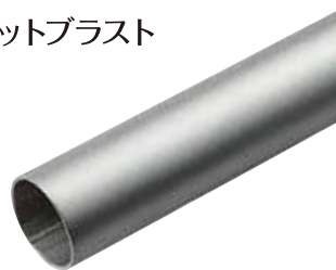
ショットブラスト

小さな凹凸をつけた仕上げです。 マットな質感になり、ヘアライン同様、 指紋やキズが付きにくいのが特長です。